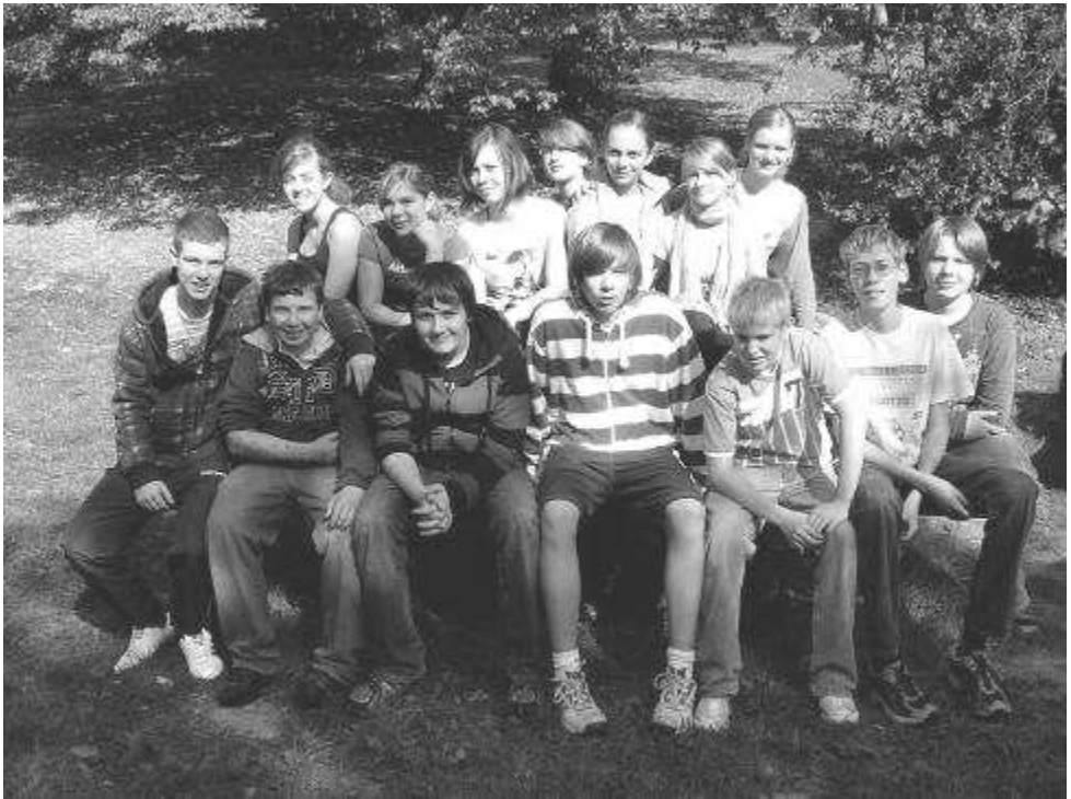
Bild der Konfirmandengruppe auf der Freizeit