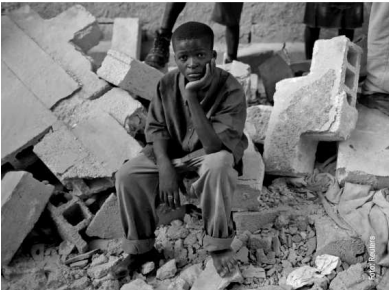
Evangelische Kirche Hessen und Nassau hilft!

Konto 4 100 000 BLZ 520 604 10 EKK Kassel Stichwort: Haiti